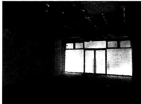
▲101号室室内 付帯設備の空調機器